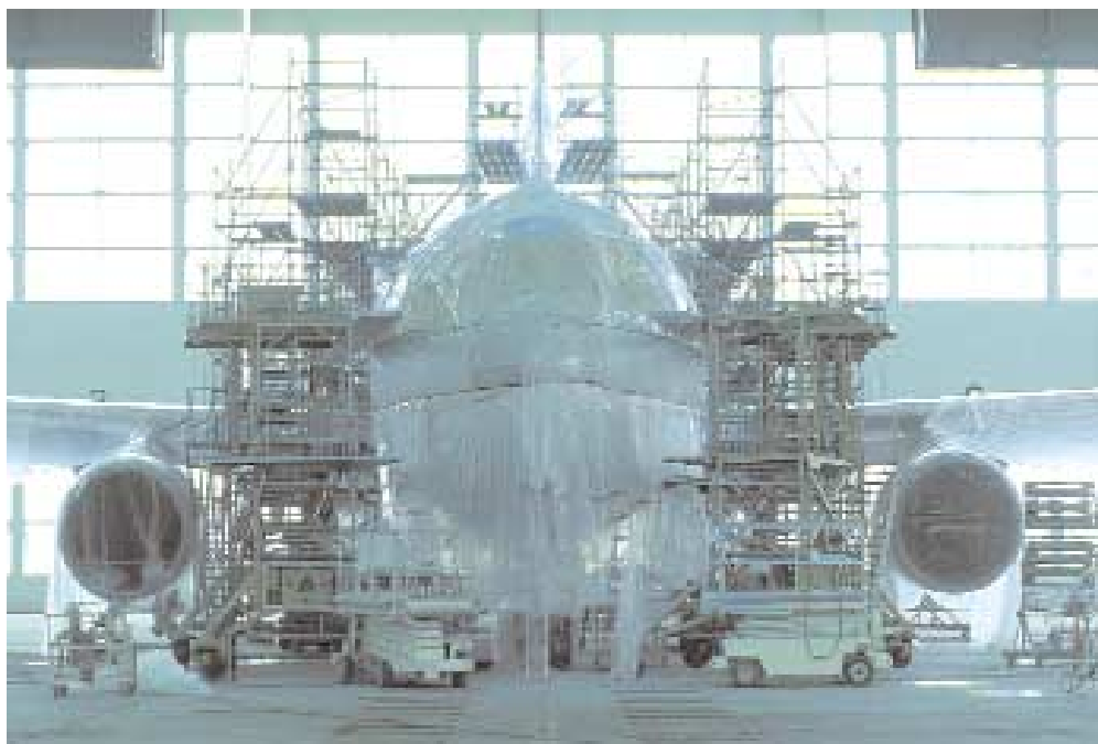
Fein säuberlich verpackt nimmt der Kunde „sein“ Flugzeug entgegen.

Mihatsch fügt hinzu: „Wir betreiben hier sozusagen verschärftes Concurrent Engineering: Nicht nur die Entwickler arbeiten parallel an den einzelnen Einrichtungsgegenständen, der Wasser- und Klimainstallation und den strukturellen