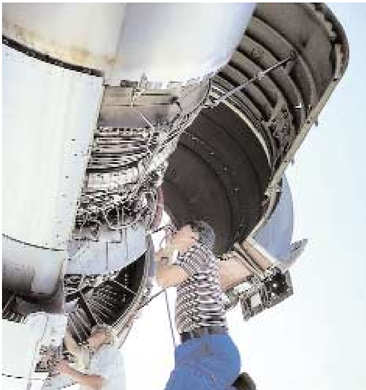
Wartungsarbeiten in der Werft der LH Technik.